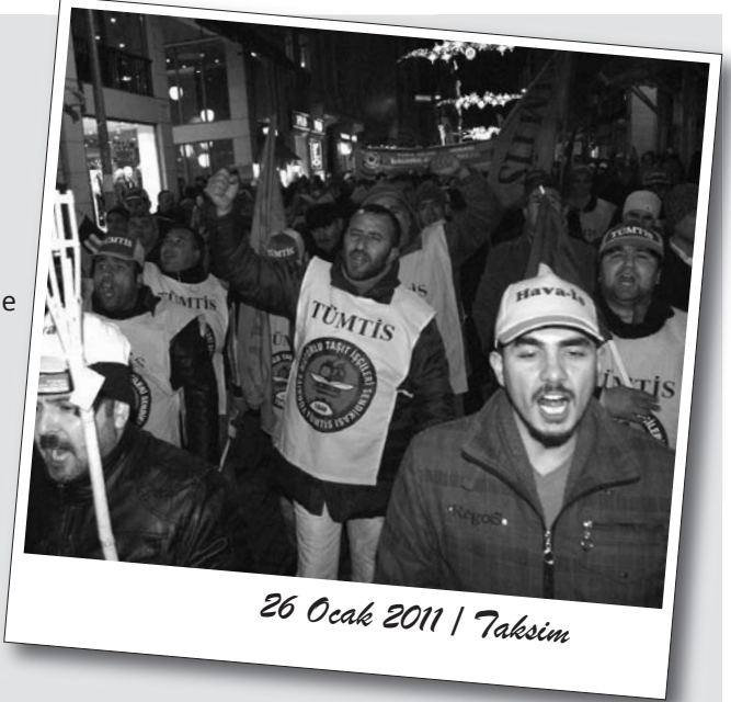
26 Ocak 2011 | Taksim

"Torba yasa işsizlik, güvencesizlik, kuralsız