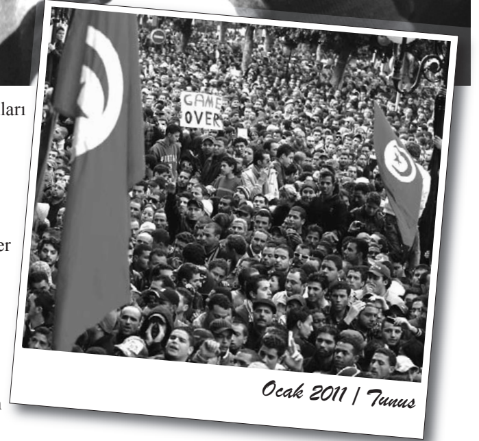
Ocak 2011 | Tunus

Aslında gençlik, kapitalist sistemin karşılamaktan aciz olduğu talepler yükseltiyor. Bu talepler ekonomik-demokratik nitelikte olsa da, sistemin bunları karşılama yeteneğinden yoksun olması, emekçi halk hareketinin devamı için nesnel zemin oluşturuyor. Dolayısıyla, ancak temel taleplerin karşılanmasıyla sonuçlanabilecek bir çatışmadır söz konusu olan. Başka bir ifadeyle bu çatışma, kapitalist sistemin yıkılmasıyla çözülebilecek niteliktedir. Emekçi halk hareketinin, nihai sonuca götüreceği yolu açmak için devrimci siyasi önderliği yaratmak dışında bir alternatifi bulunmuyor. Elbette ki, bazı